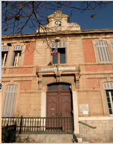
P.A.D (ancien Tribunal d'Instance)